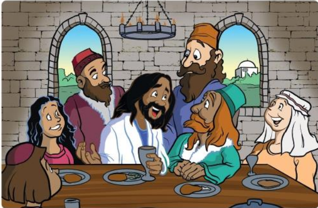
Tegning: Trevor Keen

Disse to bildene er nesten helt like. Klarer du å finne 5 feil på det ene bildet?