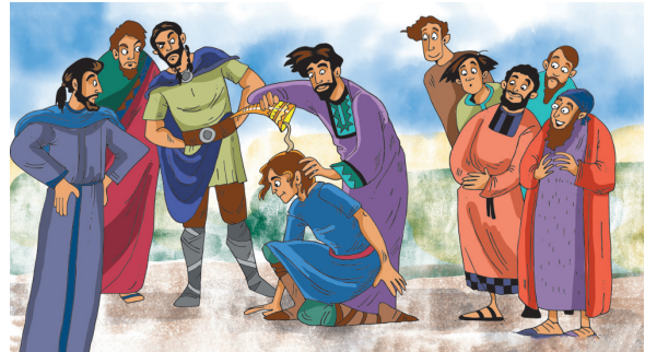
Tegning: Kari Sortland

Samuel hørte mange ting fra Gud. Da Samuel ble voksen fortalte Gud ham hvem som skulle bli konge. Kan du finne fem feil på bildet under?