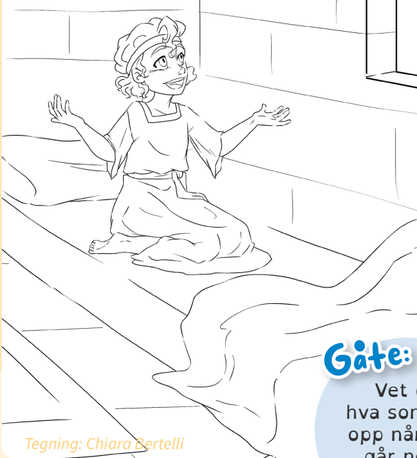
Tegning: Chiara Bertelli

Samuel var en gutt på ca. 6 år som våknet av at Gud snakket til ham! Fargelegg bildet av Samuel som våkner i senga si.